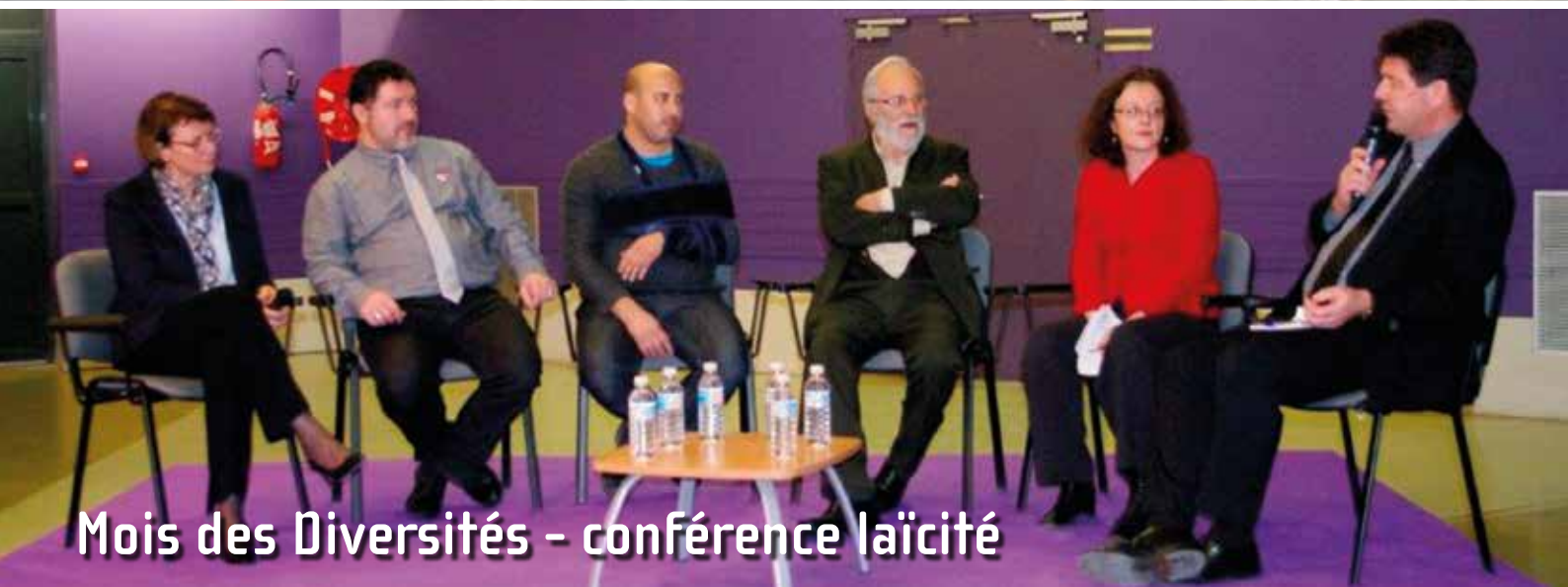
Mois des Diversités - conférence laïcité