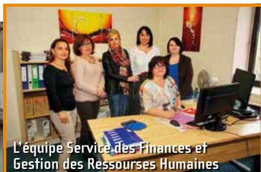
L'équipe Service des Finances et Gestion des Ressources Humaines