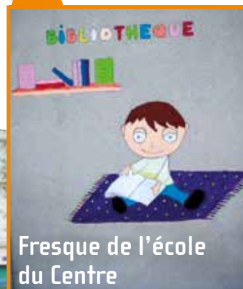
Fresque de l'école du Centre