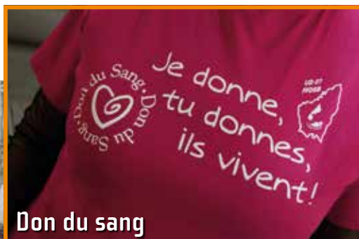
Don du sang