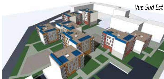
Vue Sud Est

Attendu par les habitants depuis plusieurs années, Ardèche Habitat lance un vaste programme de réhabilitation de La Violette.