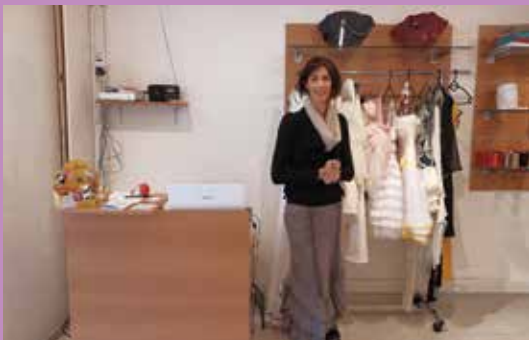
HINDA COUTURE 106, rue de la République Tél. 09 83 61 66 37