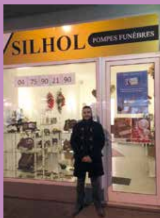
POMPES FUNÈRES SILHOL 2, boulevard Stalingrad Tél. 04 75 90 21 90