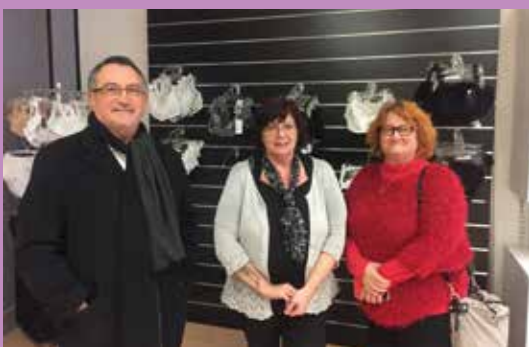
JUSTE POUR ELLES 35, rue de la République - Tél. 04 75 96 36 44

Le centre-ville a vu ces dernières semaines plusieurs commerces s'ouvrir pour le plus grand bonheur de tous les teillois. En 2016, 13 nouveaux commerces se sont installés au Teil dont 10 en centre-ville.