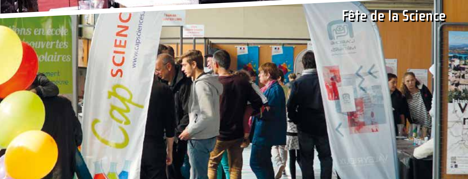
Fête de la Science