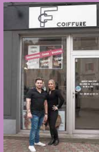
FC COIFFURE 2, impasse du Pont Tél. 06 65 47 01 71