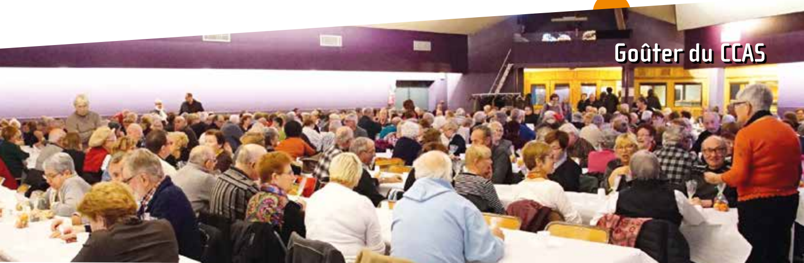
Goûter du CCAS