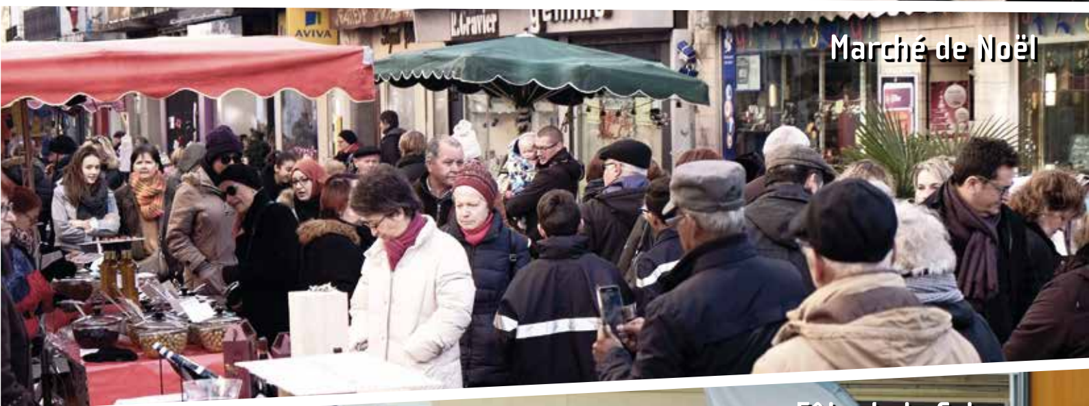
Marché de Noël