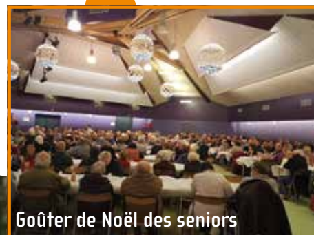
Goûter de Noël des seniors