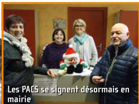
Les PACS se signent désormais en mairie