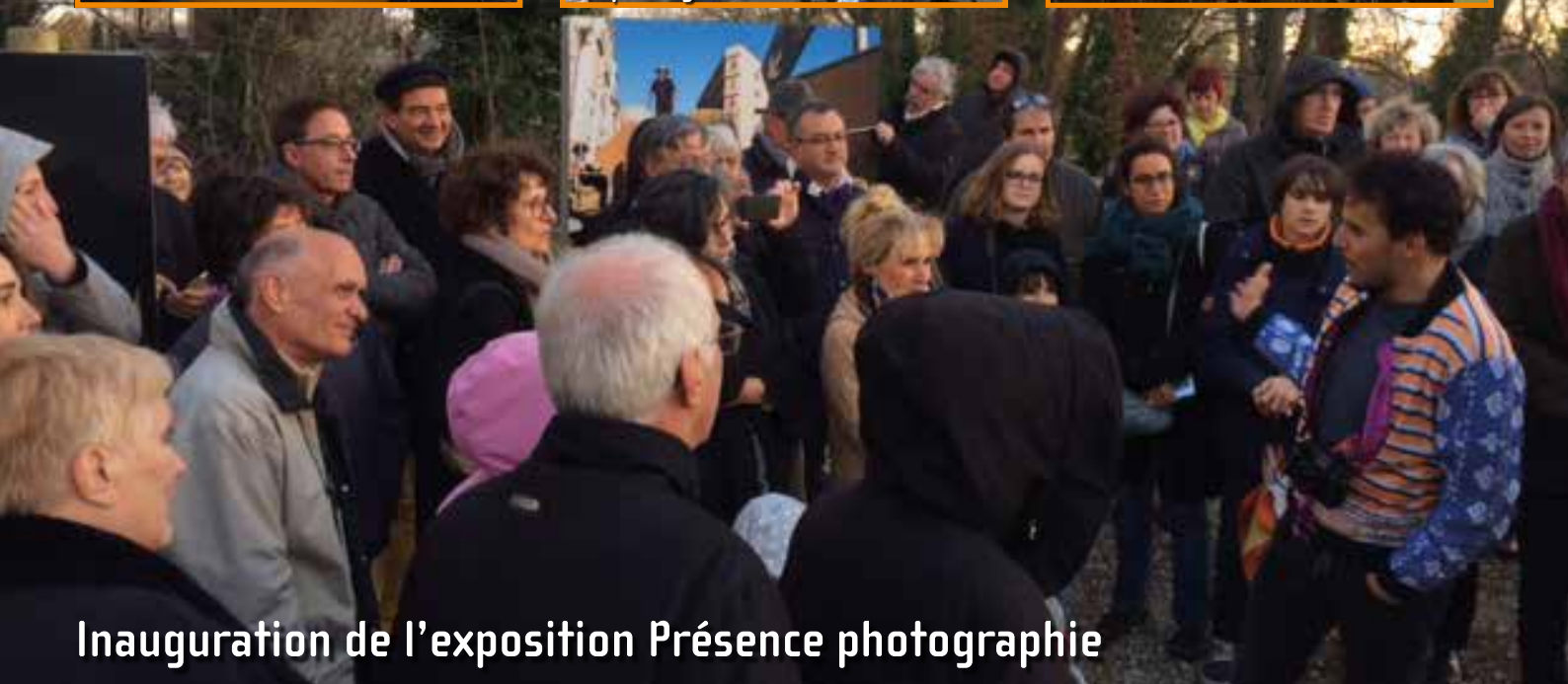
Inauguration de l'exposition Présence photographie