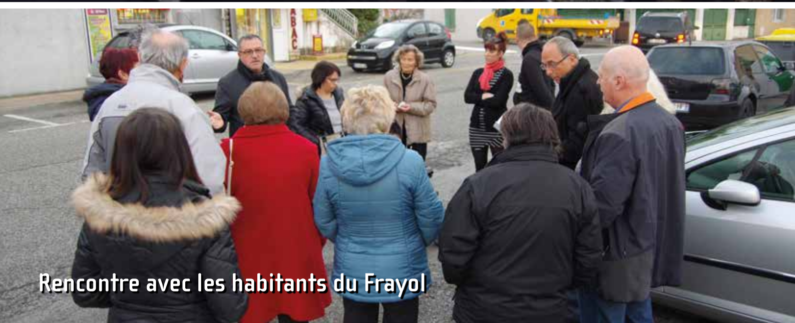
Rencontre avec les habitants du Frayol