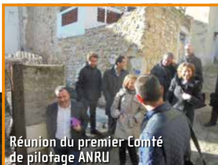
Réunion du premier Comté de pilotage ANRU