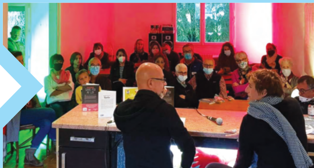
Les cafés littéraires