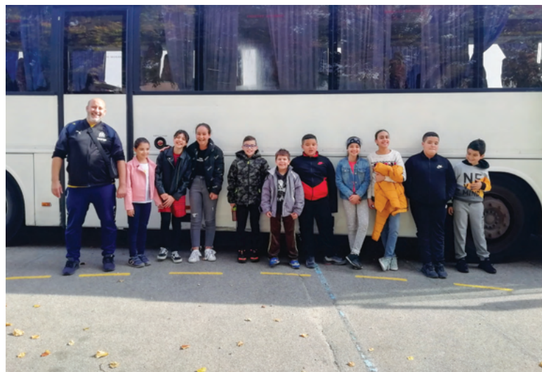
"Les colonies apprenantes"