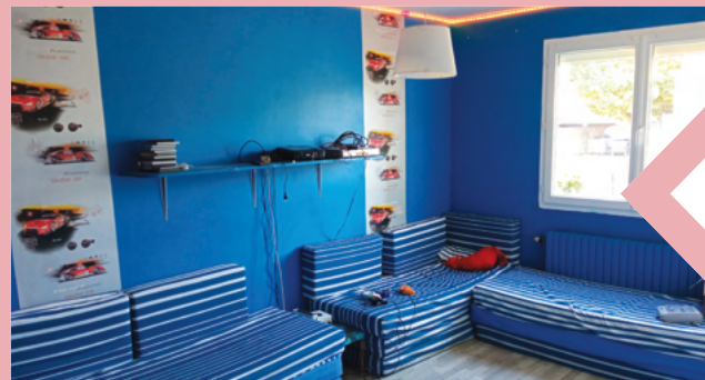
La salle rérogaming