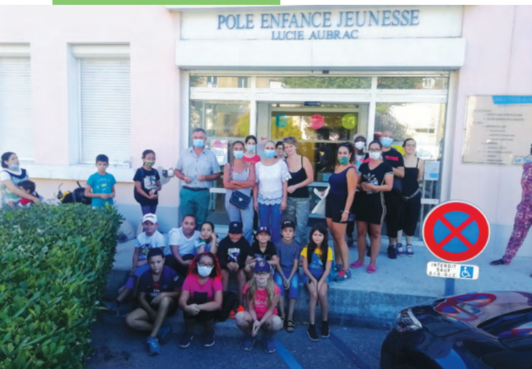
"Tout doux la reprise"