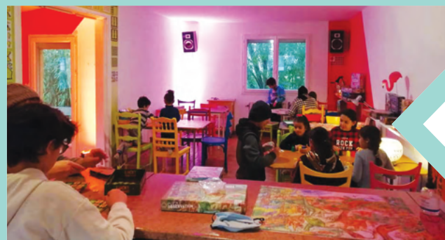
La salle de jeux