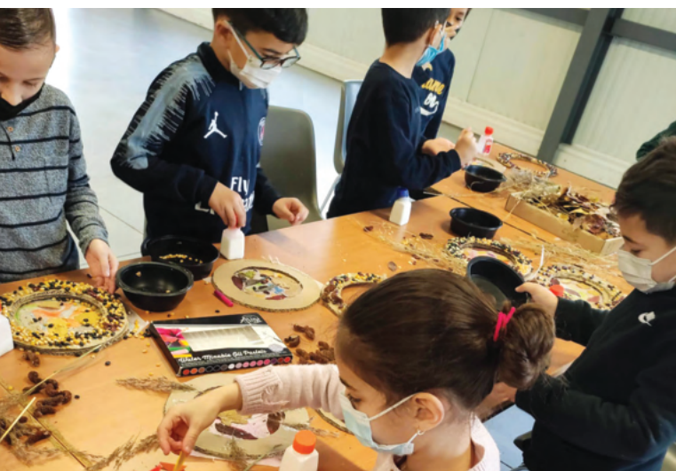
"Les mercredis découverte"