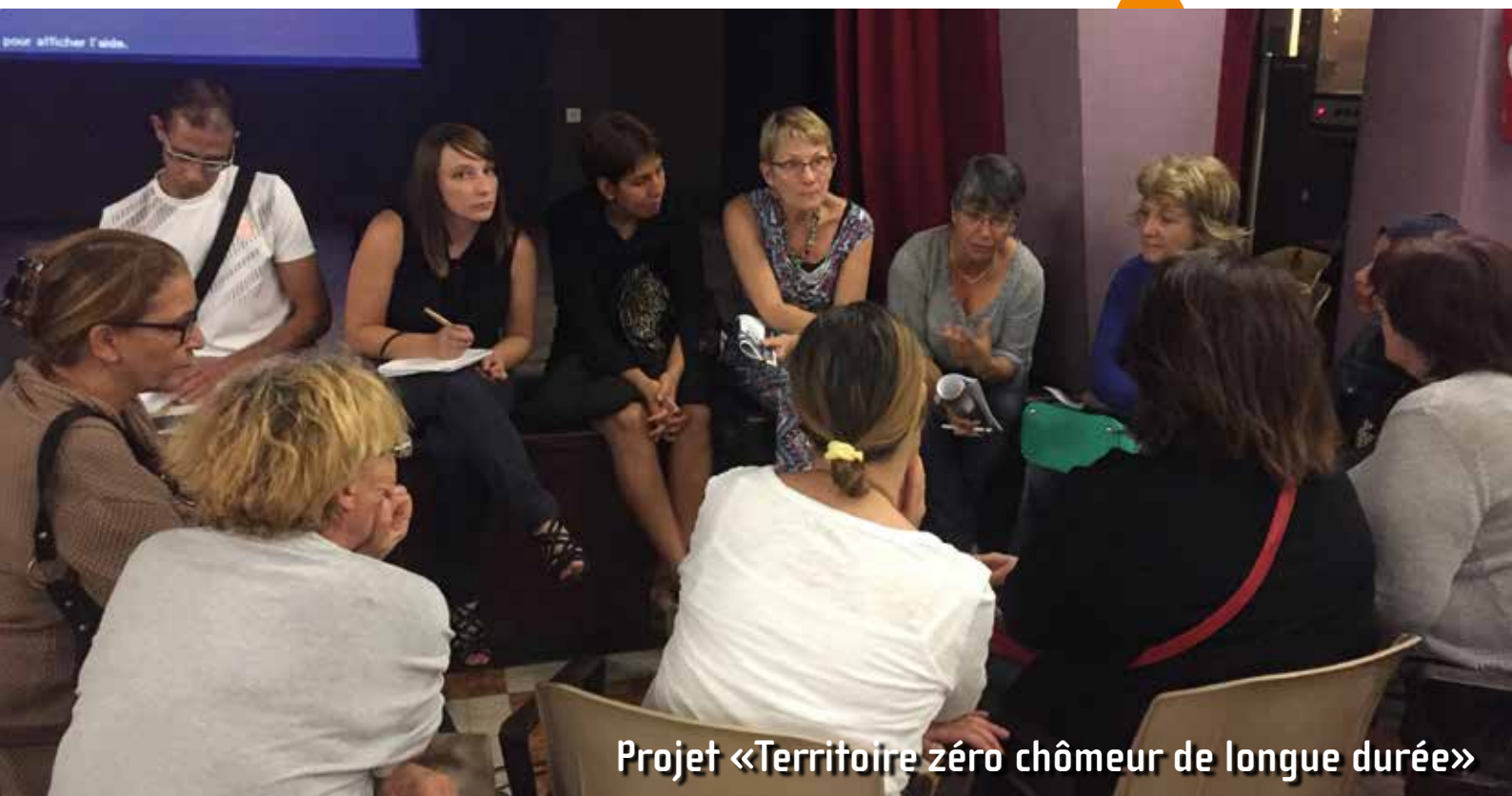
Projet «Territoire zéro chômeur de longue durée»