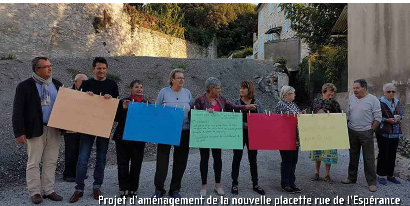
Projet d'aménagement de la nouvelle placette rue de l'Espérance