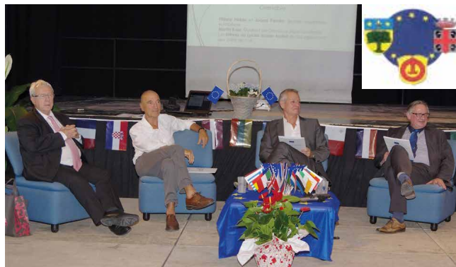
Soirée débat du 31 mai dernier

Les premières années de ce partenariat ont permis aux habitants des 3 villes de se rencontrer pour apprendre à mieux se connaître et ainsi contribuer à la reconstruction d'une Europe des citoyens. Les rencontres, les échanges, les fêtes d'anniversaires, le camp international entre autres était programmé par les trois maires lors d'une rencontre annuelle organisée à tour de rôle par l'une des trois villes jumelles.