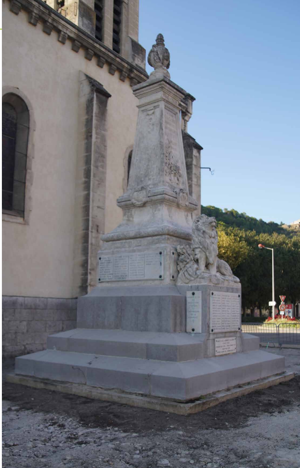
Le monument aux morts avant le lancement du chantier

A cela, il faut rajouter que la fabrication de ballons fluos très énergivores, qui équipent la plupart de nos luminaires, est arrêté, et que par conséquent le remplacement des luminaires s'impose. Cette année, c'est le quartier de Frayol bas qui a été choisi, et les 64 luminaires actuels seront remplacés par des luminaires sodium pour un montant de 28 758,00€ HT subventionnés à hauteur de 50% par Le Syndicat Départemental d'Énergie.