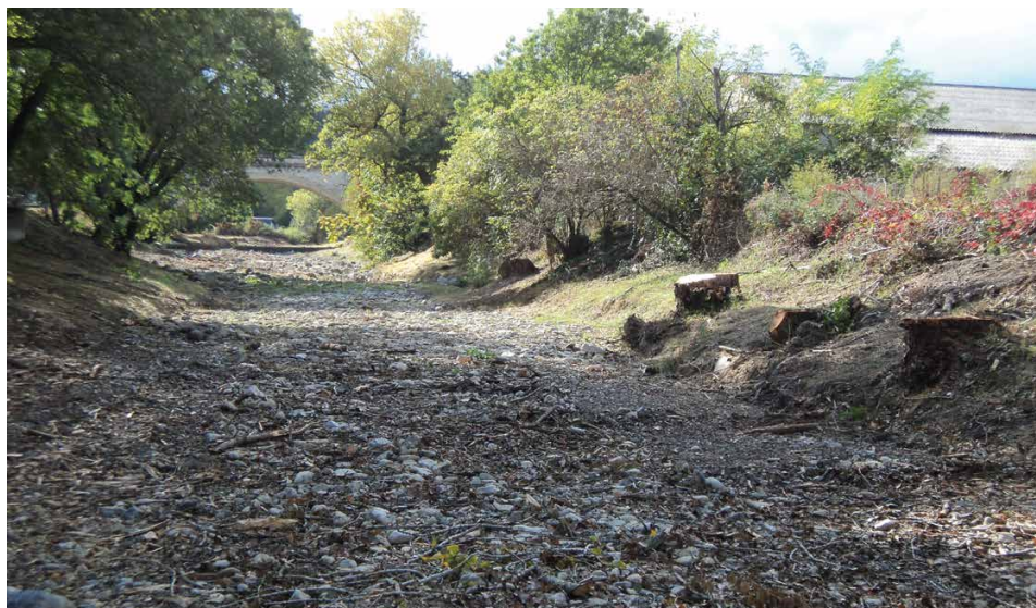
Schéma global de gestion du risque inondation du bassin versant du Frayol

Ces opérations d'entretien sont réalisées par le SMBEF.