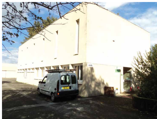
Les nouveaux locaux des Services Techniques

Les locaux libérés, « les anciens abattoirs », situés allée Paul Avon accueilleront dans quelques mois, la nouvelle scène de musiques actuelles, la SMAC 07.