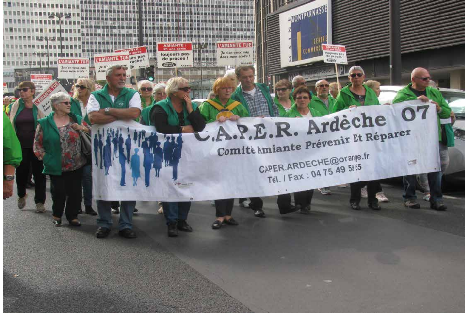
Le comité lors de la manifestation nationale du 12 octobre dernier.

Ce comité a été créé par une poignée d'anciens ouvriers de Basaltine. Depuis bientôt 15 ans, il aide les malades et leurs familles à défendre leurs intérêts auprès des diverses administrations que sont la Caisse Primaire d'Assurance ou le FIVA (Fond d'indemnisation des victimes de l'amiante).