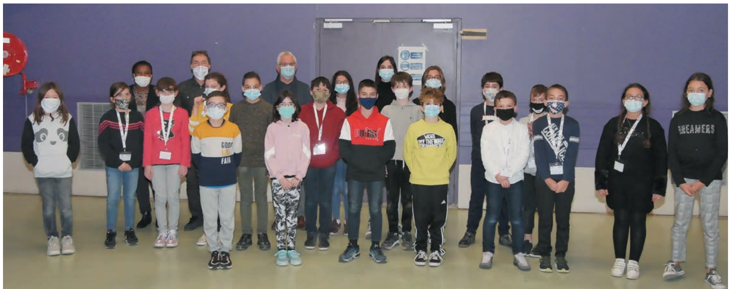
Les conseillers lors de leur première réunion