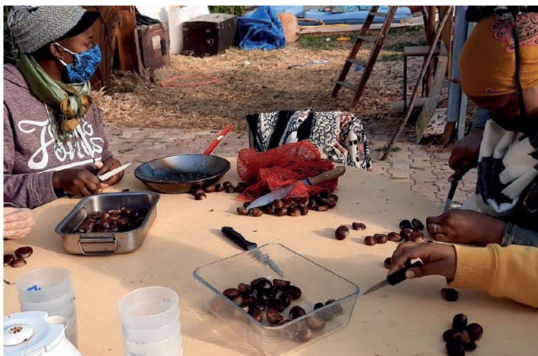
Photo des bénévoles de l'association Mayesha Espoir testant la transformation des châtaignes.