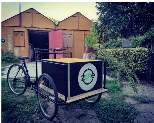
Photo du vélo triporteur permettant de réaliser la collecte des biodéchets au Teil.

Une entreprise dont le but est d'embaucher en CDI et à temps choisi les personnes sans emploi depuis au moins un an et domiciliée sur un territoire hébergeant une EBE depuis au moins 6 mois. L'EBE propose des activités non concurrentielles sur le territoire afin de ne détruire aucun emploi. Les activités proposées sont donc généralement soit innovantes, soit sur un domaine plus classique mais sur lequel aucune entreprise du territoire ne s'est positionnée.