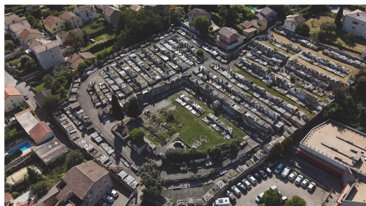
Cimetière du Centre