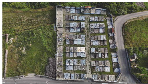
Cimetière de Mélas Bas

37 bis Avenue Vaillant Couturier 07400 Le Teil