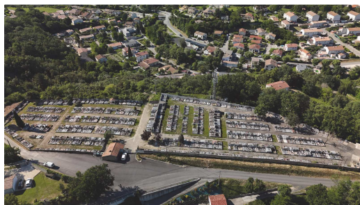
Cimetière de Fayol