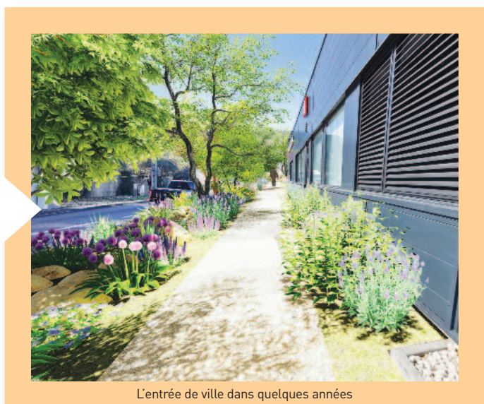
L'entrée de ville dans quelques années

Ce chantier d'embellissement sera terminé dans quelques jours avec la pose de barrières entre l'aménagement paysager et la route.