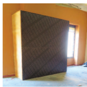
La cheminée de la salle du conseil au premier étage sera préservée. Elle sera pendant toute la durée des travaux protégée par un caisson. Le carrelage d'époque sera lui aussi conservé.