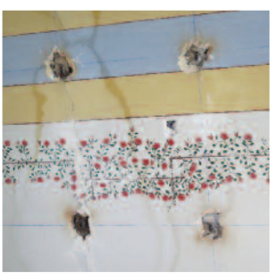
Le déshabillage des murs laisse apparaître des décorations d'un autre temps, ici au plafond du hall d'entrée.

Le bâtiment sera mis aux normes d'accueil des personnes à mobilité réduite, ce qui n'était pas le cas jusqu'à présent dans l'ensemble de la mairie.