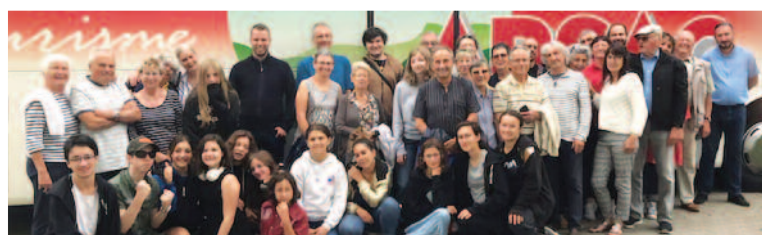
La délégation au départ pour Raunheim en août 2023