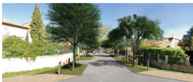
Visuel des aménagements futurs de la rue

Dans la foulée, courant novembre, 20 sujets de différentes essences seront replantés ainsi que de nombreux végétaux.