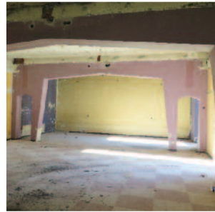
La salle des fêtes un peu lugubre du rez-de-chaussée sera transformée en salle du conseil et des mariages. Elle donnera directement sur le nouveau jardin et sera éclairée grâce au puits de lumière.