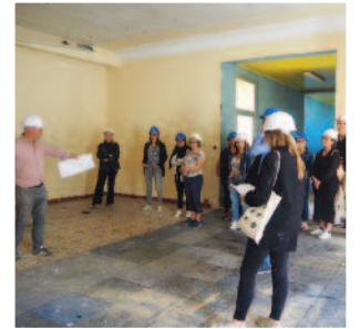
Début octobre, une visite du chantier a été organisée pour les agents et les élus afin de faire le point avec eux sur le début du chantier.

Un ascenseur sera également installé. L'accueil des usagers sera amélioré par la mise en place d'un guichet unique. Il permettra d'orienter les citoyens vers les services compétents. Les agents municipaux gagneront en confort de travail : au deuxième étage, la toiture sera rehaussée afin de rendre les bureaux plus confortables.