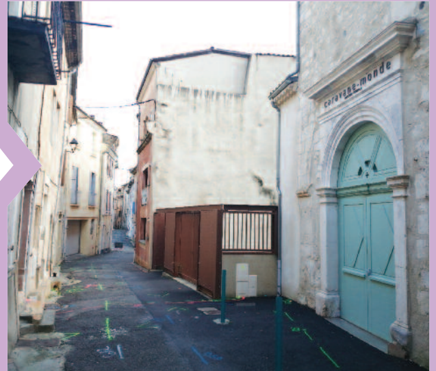
Travaux rue Kléber

A noter également que les travaux du futur giratoire de La Sablière démarreront cet automne pour une ouverture à la circulation en même temps que la déviation.