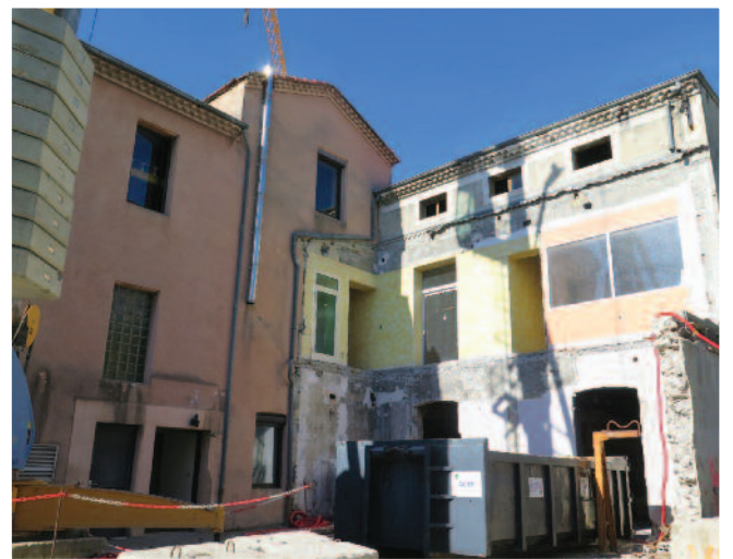
Un jardin sera installé à la place du bâtiment qui accueillait la police municipale.

Des ouvertures seront créées pour gagner en luminosité. L'ancienne salle des fêtes sera transformée en salle du conseil et des mariages, avec un accès dédié via le nouveau jardin qui sera implanté en lieu et place du bâtiment démolé (qui abritait notamment la Police Municipale).